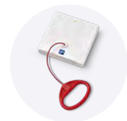
PULL Der Funk-Zugtaster