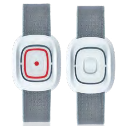
SMILE Der Funksender

NEMO unterstützt bis zu acht Funkkomponenten, wobei für jede Komponente ein eigener Alarmtyp einstellbar ist. Durch eine Funkstreckenüberwachung werden Funkfehler und Funktionstüchtigkeit erkannt. Pro Funkkomponente ist ein individuelles Zeitfenster (von/bis Uhrzeit) programmierbar.