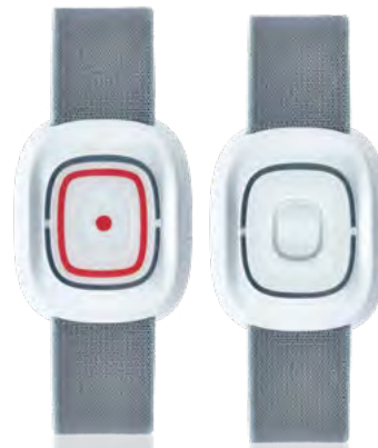
SMILE Der Funksender

Die Alternative SMILE-ID verhindert über die integrierte Aktivitätskontrolle Fehlalarme, falls die Tagestaste nicht gedrückt wurde.